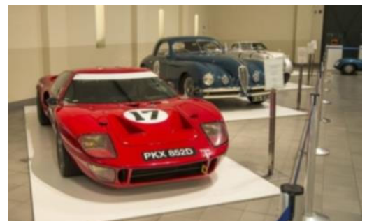
Franschhoek – einmaliges Motor Museum

Doppelter Genuss – erlesene Fischgerichte und Köstlichkeiten aus der Thaiküche, dazu ein phantastisches 280° Panorama.