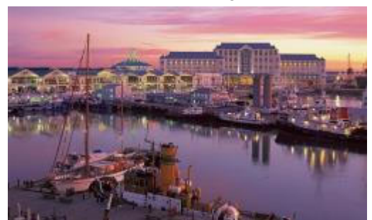
Kapstadt – schillernde Waterfront