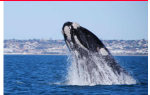
Hermanus – Wal vor der Küste